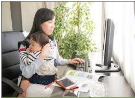
特助くん支援員(患儿ママ)